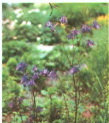
82. Орлики звичайні.